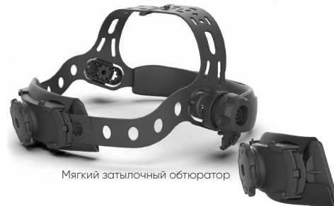
Мягкий затылочный обтюратор

Схема сборки наголовника и его настройка под индивидуальные параметры