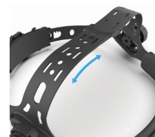
Регулировка ляжки для обхвата головы