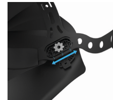
Трех ступенчатая регулировка расстояния от глаз до светофильтра