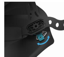
Регулировка наклона для смены угла обзора