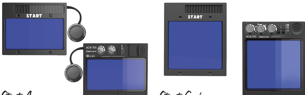
Start Argon АСФ 705