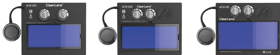
Start Norma АСФ 505 Start Comfort